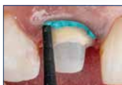
Łatwa aplikacja do kieszonki dziąsłowej